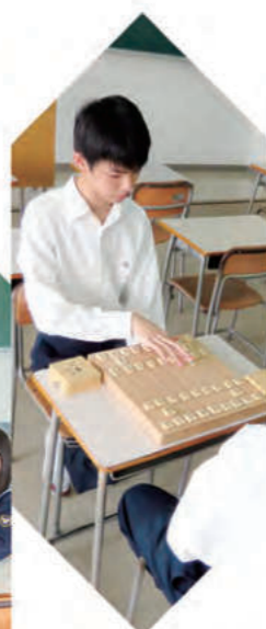
囲碁・将棋部 - Igo & Shogi -