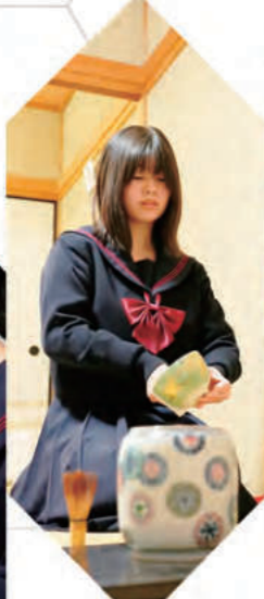
茶道部 - Tea Ceremony -