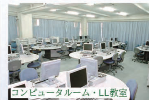
コンピュータールーム・LL教室