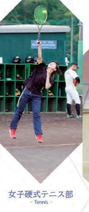
女子硬式テニス部 - Tennis -