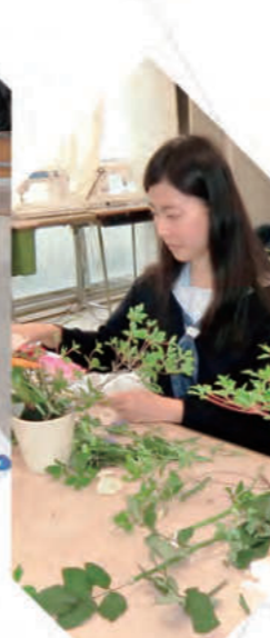
華道部 - Flower Arrangement -