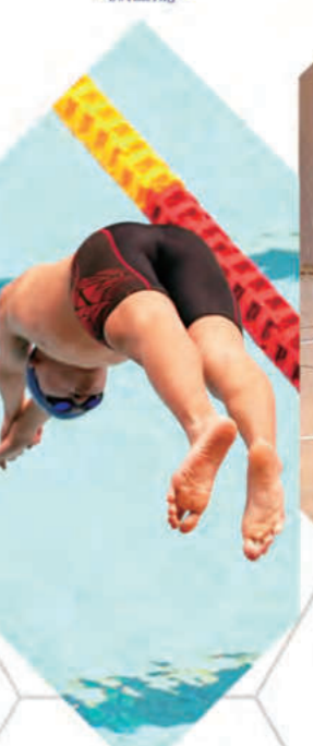
水泳部 - Swimming -