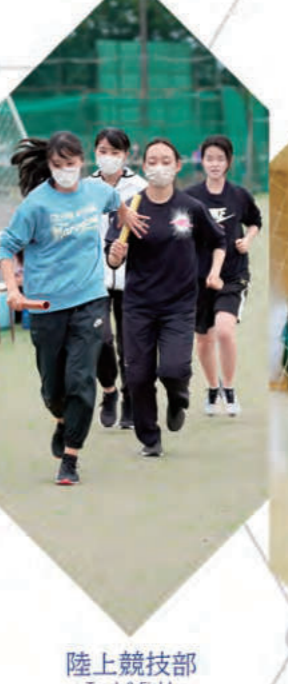
陸上競技部 - Track & Field -