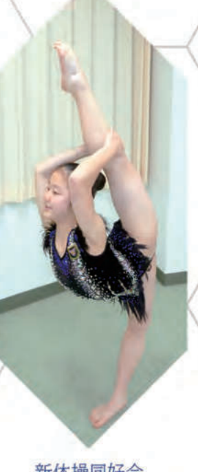
新体操同好会 - Rhythmic Gymnastics -