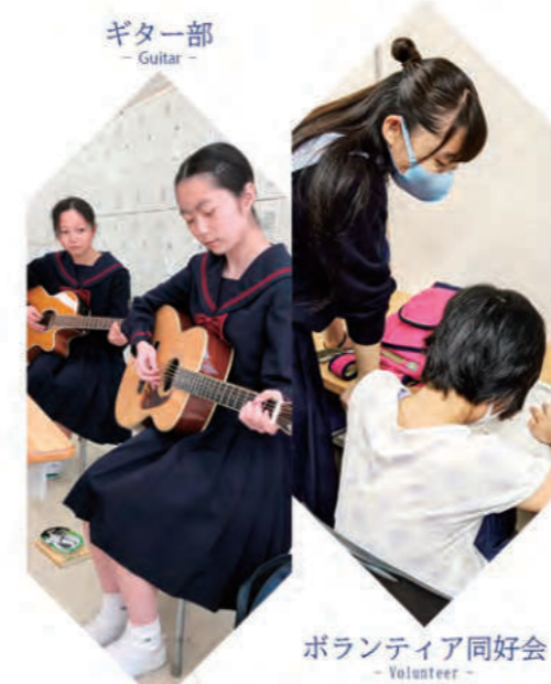
ギター部 - Guitar -