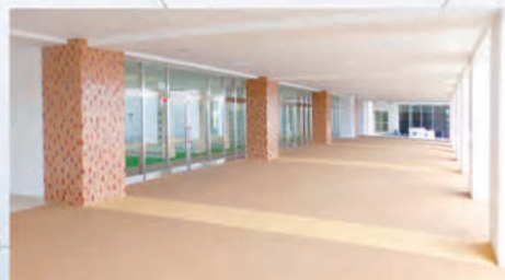
昇降口前ピロティ

遠くに富士山を仰ぐ緑豊かな自然環境の中、敷地面積約54,000m 2 に校舎が立ち、ゆとりある学習環境が生徒たちの成長を助けます。 また、設備面でも、コンピュータールーム(2つ)やLL教室、体育館(3つ)など、情報教育施設から各体育施設まで生徒たちに活用されています。