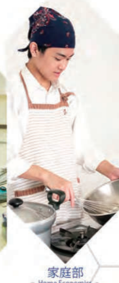
家庭部 - Home Economics -