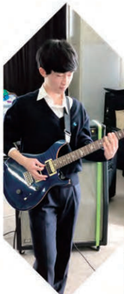
軽音楽部 - Band -