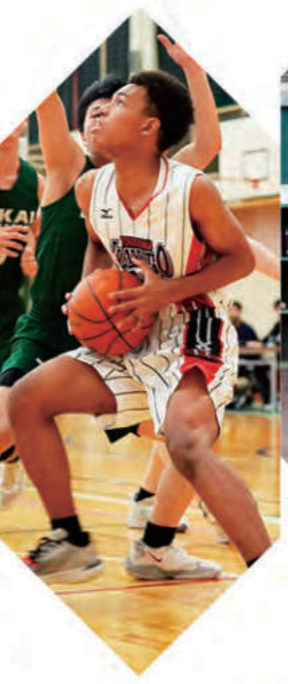
男子バスケットボール部 - Basketball -