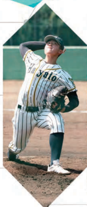
硬式野球部 - Baseball -