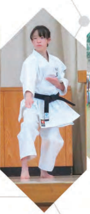
空手道部 - Karate -