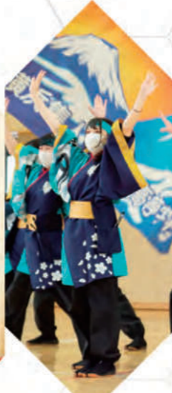
レクリエーション部 - Recreation -