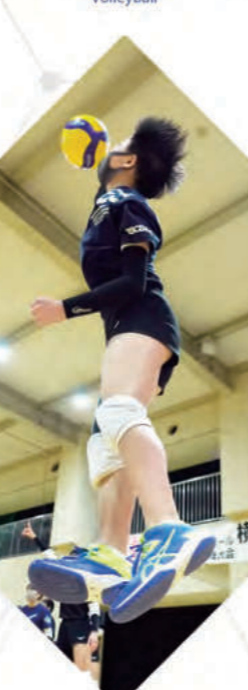
女子バレーボール部 - Volleyball -