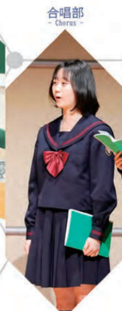
合唱部 - Chorus -