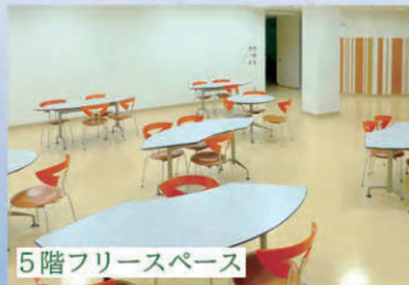
5階フリースペース