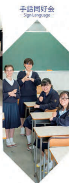
手話同好会 - Sign Language -