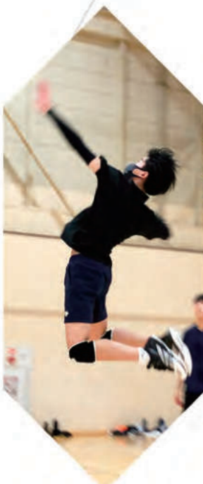
男子バレーボール部 - Volleyball -