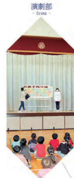
演劇部 - Drama -