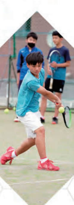
男子硬式テニス部 - Tennis -