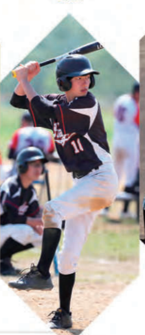
男子ソフトボール部 - Softball -