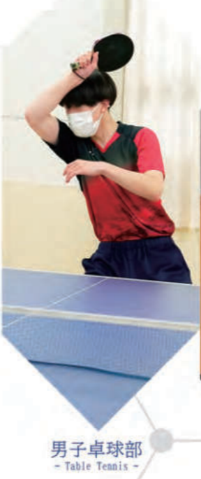
男子卓球部 - Table Tennis -