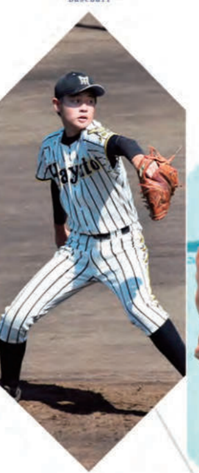
軟式野球部 - Baseball -