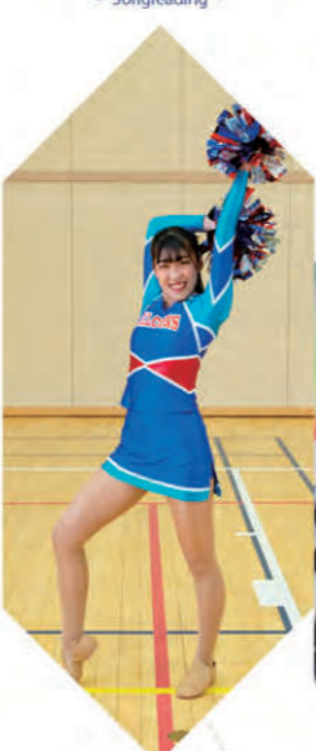
ソングリーディング部 - Songleading -