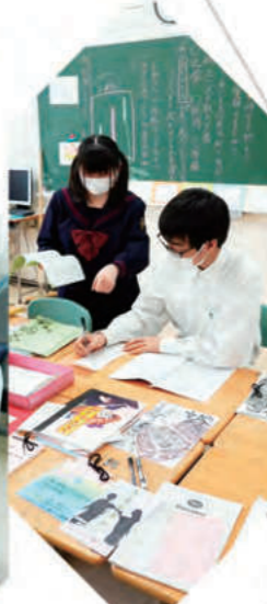
文芸部 - Literature -