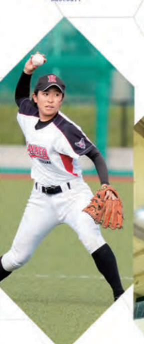
女子硬式野球部 - Baseball -