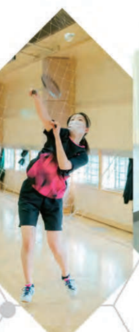
バドミントン部 - Badminton -