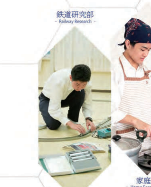
鉄道研究部 - Railway Research -