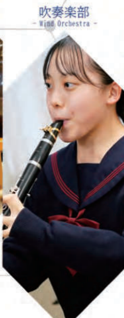
吹奏楽部 - Wind Orchestra -