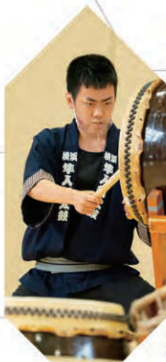
和太鼓部 - Japanese Drums -