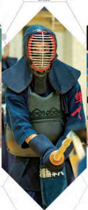
剣道部 - Kendo -