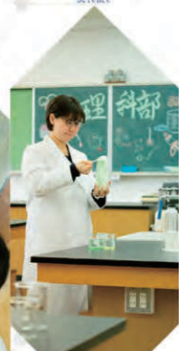
理科部 - Science -