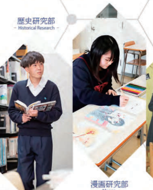
歴史研究部 - Historical Research -