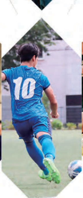
サッカー部 - Soccer -