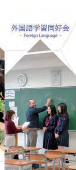
外国語学習同好会 - Foreign Language -