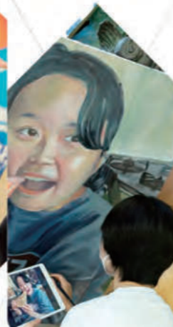
美術部 - Art -