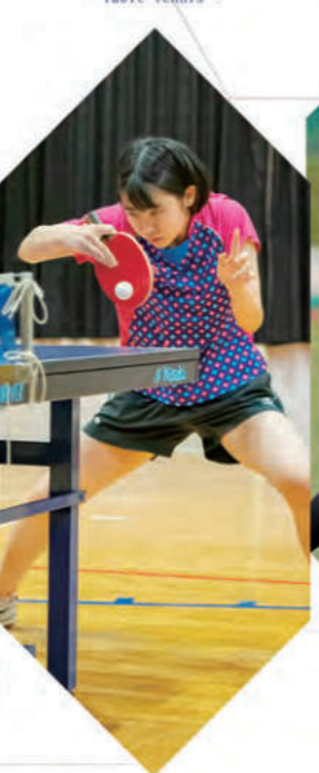
女子卓球部 - Table Tennis -