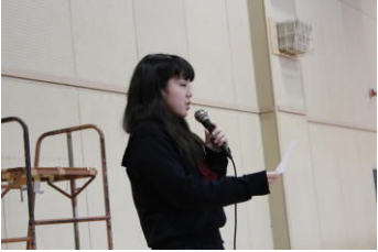
ネイティブを含めて総勢 18人の先生方紹介! 歓迎の挨拶は、もちろん英語で!