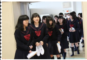
新入生入場! 緊張の面持ち。