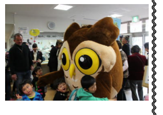
せやまるくんは 子どもたちに人気！

カナダ語学研修結団式 （3月14日）期末試験が終わってほっとつかの間、1年生はカナダ語学研修の結団式を行いました。次の週の17日にはカナダに旅立つことになる生徒ですが、まだまだ実感がわかない様子でした。