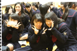
試験が終わった開放感でおおはしゃぎ？

カナダ語学研修結団式 （3月14日）期末試験が終わってほっとつかの間、1年生はカナダ語学研修の結団式を行いました。次の週の17日にはカナダに旅立つことになる生徒ですが、まだまだ実感がわかない様子でした。