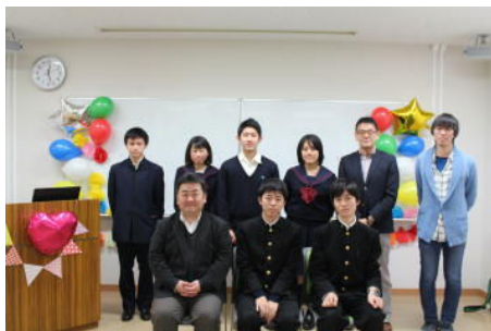
釜石高校、隼人高校の生徒会 これからも一緒に頑張ろう！

瀬谷バス募金 （3月11日）毎年本校生徒がお世話になっている「瀬谷ボランティアバス」のための募金活動が、東日本大震災のこの日に毎年行われており、本校生徒も参加しています。この日は小雨の寒い中にもかかわらず、1時間の募金活動で約9万円もの募金が集まりました！ただ支援をしている被災地釜石市はまだまだ復校したとはいえない状況です。今後も皆さんの瀬谷バスへの参加・協力をお願いします！