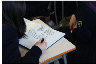
卒業式後は、緊張もほどけて和気あいのクラスでのホームルームでした。