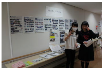
いままでの隼人生の ボラバスでの活動を掲示