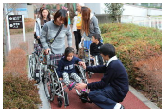
車いす体験の補助を 行いました。