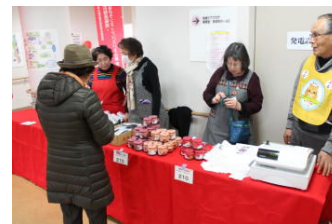
釜石市の物産展も 大盛況！