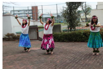
聴覚障害者向けの 「無音フラダンス」！