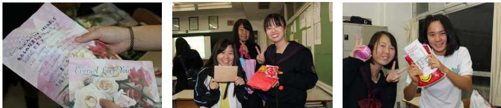
手紙の中には、日本語での挨拶も！ 手紙だけでなく、ミャンマーの友だちからプレゼントも入っていて、生徒は大喜び！

JUNKO ASSOCIATION (明治学院大学国際協力学生NPO団体)のご協力で、国際語科の生徒約50名は、ミャンマーの高校生徒と年2回文通を行っています。