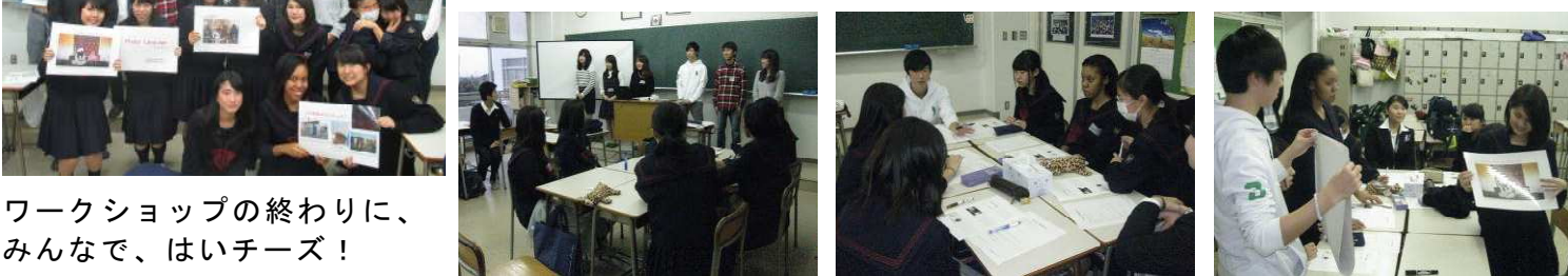
ワークショップの終わりに、みんなで、はいチーズ！