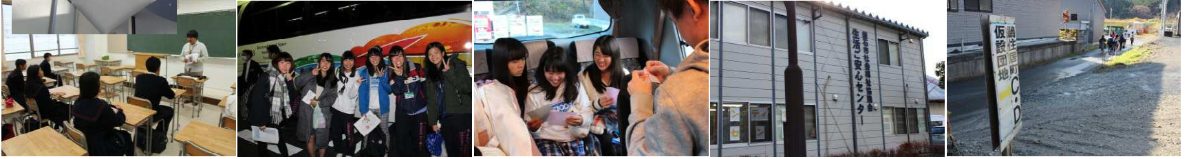
事前説明会の様子 21:00出発です！ バス中、当地での活動準備 釜石市社会福祉協議会 仮設住宅へ向かいます

瀬谷ボランティアバスで釜石に行ってきました！(11月20日～22日) 今回国際語科は7人(全員1年生!)が参加しました。ボランティアをするだけでなく、当時のお話を聞かせていただいて、実りあるボラバスでした！