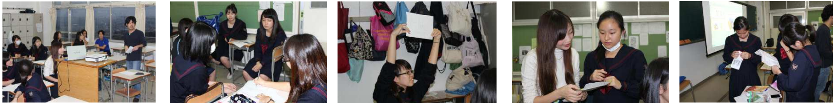
ミャンマーの最新情報を、パネルクイズ形式で！グループ対抗で考えて盛り上がりました！ クイズの後には、いよいよミャンマーの文通相手の生徒からの返事が手渡されました！