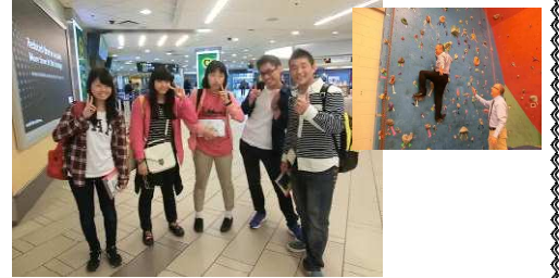
バンクーバーから飛行機で各校に別れていきました。