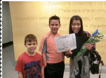
ホストファミリーのお出迎え。嬉しい！