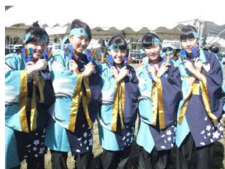
いわき市、石巻市の物産の販売ボランティアがんばりました！