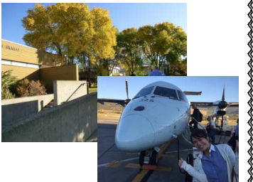
国内便はプロペラ機！