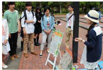
JUNKOの発表を見学。丁寧に説明してくださいました。