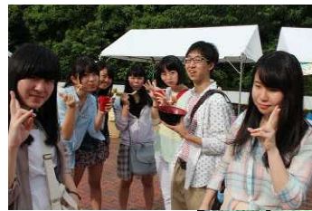
やっぱり大学祭は模擬店!