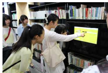
今春完成した大学図書館は最新の設備!