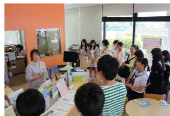
ボランティアセンターで説明を受けました。