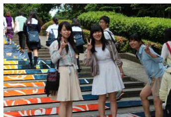
大学キャンパスは学園祭ムード!