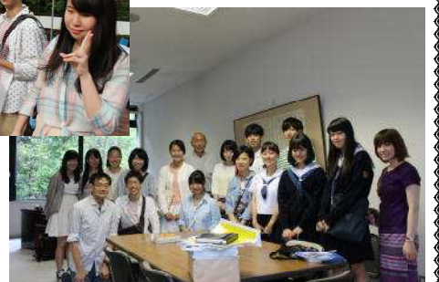
国際学部学部長先生と学部長室で。