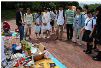
学生NGOの方々から、説明を受けながら大学を巡りました。大学生の方々の熱い思いが伝わりました!