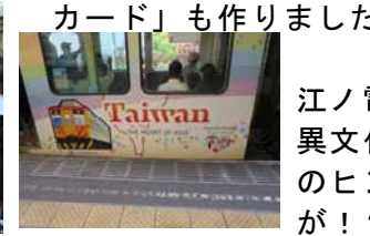
江ノ電にも異文化理解のヒントが!?

Hey first year students! Did you have a good time at Kamakura? I did and I know the other teachers also enjoyed hanging out with you for the day. Thanks for taking care of us and teaching us about Kamakura. You successfully used English, whether it was a little or a lot, to communicate with a bunch of English speakers, most of whom you met for the first time that day. This makes me feel confident that you'll be ok next year in Canada. Keep it up in preparation for the big trip! (ブラウン先生)