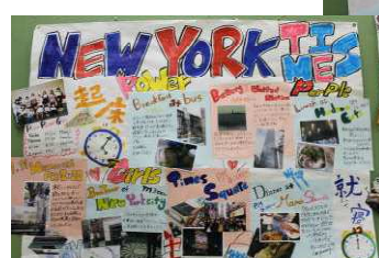
報告で使った模造紙は、ピロティに掲示してあります。