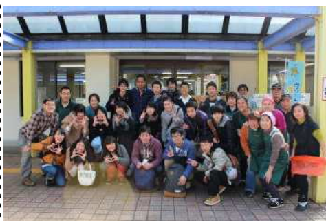
ボランティア全員そろって！

「ぼかぼかフラザうめまつり」にボランティア参加しました！（2月28日） 「阿久和南部地区学習支援クラブ」が行われている「ぼかぼかプラザ」でうめまつりを開催しました。国際の生徒4名を含む、20名の生徒がその運営のお手伝いをしました。