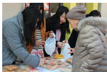
お総菜もどんどん売れます！