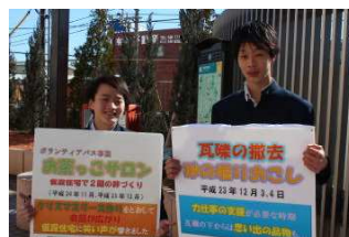
パネルを持って、ポラバスの宣伝も！