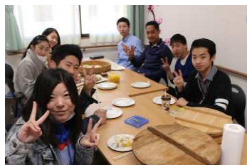
お昼ご飯はちらずし！