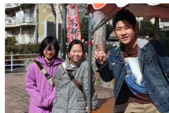
学習支援の児童も来てくれました。