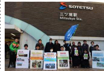
本校生徒10名（国際4名）が瀬谷区の方々と一緒に活動しました。募金総額は約15万円でした！