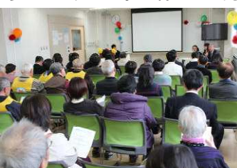
ボランティアバスが始まってのべ50名以上の生徒が参加しています。多くの方々にポラバスの活動を聴いていただきました。

「ボランティアのつどい」で発表しました（3月14日 せやまるふれあい館） 国際の生徒が多く参加しているボランティアバスの発表を、瀬谷区の方々向けに行いました。当日は、釜石から仮設住宅の自治会長さんやポラバスで仲良くなった釜石高校の生徒も参加し、当時の様子や現在の状況を話してくださいました。