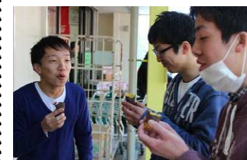
試食の焼き芋、美味！