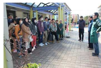
お疲れ様でしたー！