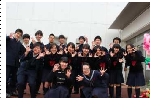
隼人生・釜石高生一緒に記念写真！希望ヶ丘商店街で行われる「希望ヶ丘フェスティバル」では、釜石復興支援のための催しを企画したいと考えています。

「ボランティアのつどい」で発表しました（3月14日 せやまるふれあい館） 国際の生徒が多く参加しているボランティアバスの発表を、瀬谷区の方々向けに行いました。当日は、釜石から仮設住宅の自治会長さんやポラバスで仲良くなった釜石高校の生徒も参加し、当時の様子や現在の状況を話してくださいました。