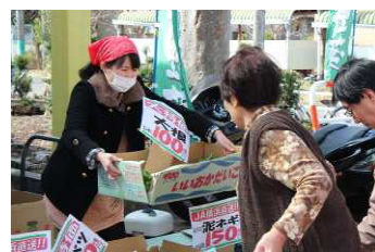
野菜の販売もお手伝い。