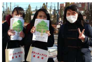
相原先輩（右）も募金をしてくれました。