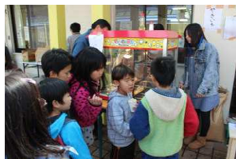
ポップコーンが大人気！