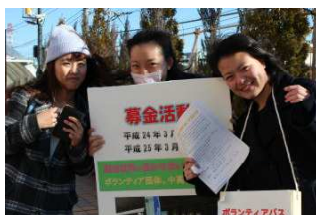
藤野先輩（左）が駆けつけてくれました。