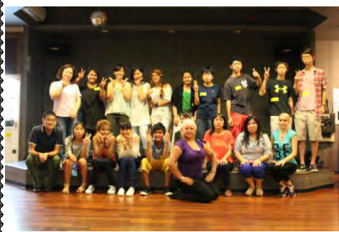
みんなそろって。ダンスの後すっかり打ち解けました!