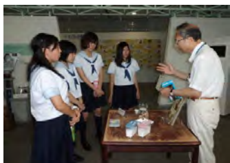
2 階では体験しながらユニセフの取り組みを学べます。

① 中南米学習フィールドワーク(7月29日 品川、目黒) このグループは午前中は品川駅にあるユニセフハウス(ユニセフ協会東京本部)を見学し、開発途上国の事情とユニセフの取り組みについて学びました。お昼をエスニック料理のレストランで食べて、午後からは中南米文化サロンでアルゼンチン、ベネズエラ、ハイチの方をお招きしてお話をうかがったり、ダンスを体験したりしてそれぞれの国について理解を深めました。