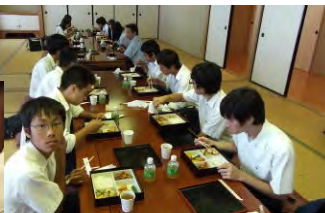
お昼はちきゅうひろばの中で。エスニック弁当を和室で!?