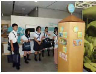
部屋いっぱいに学びのヒントが。