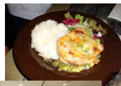
←品川の駅ビルの中のおしゃれなカフェで昼食。

① 中南米学習フィールドワーク(7月29日 品川、目黒) このグループは午前中は品川駅にあるユニセフハウス(ユニセフ協会東京本部)を見学し、開発途上国の事情とユニセフの取り組みについて学びました。お昼をエスニック料理のレストランで食べて、午後からは中南米文化サロンでアルゼンチン、ベネズエラ、ハイチの方をお招きしてお話をうかがったり、ダンスを体験したりしてそれぞれの国について理解を深めました。