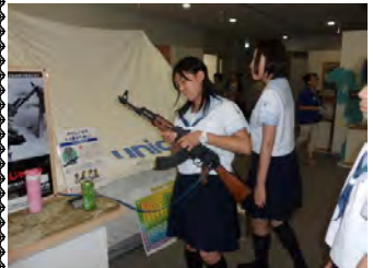
この銃による悲劇が後を絶ちません。