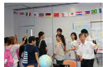
鶴見区国際交流ラウンジでは、日本語ボランティアも募集しています。