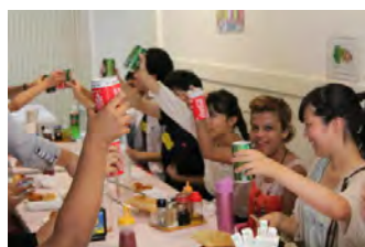
お昼はブラジル料理。キャッサバのフライなど、エスニックを堪能。ガラナジュースで乾杯!