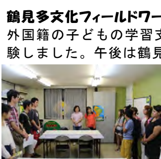
A B C ジャパンの事務所で、子どもたちと対面。