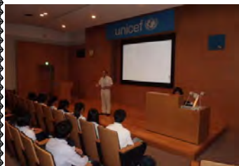
ホールで、ユニセフの仕事について説明。

今年の夏も、国際語科 2 学年夏期研修が行われました。今回は「多文化にまつわる場所へ行き、人と出会う」というテーマで、7 月 29 日に 3 方面、8 月 5 日に 2 方面のフィールドワークを行いました。2 号に分けてご報告します。