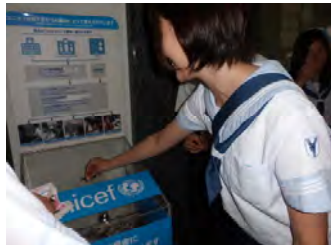
最後に募金もしました。