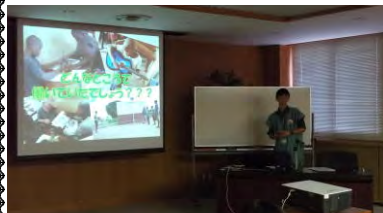
J I C A ちきゅうひろばでは、青年海外協力隊の O B ・ O G が映像や豊富な展示物を使って国際協力について説明してくださいました。