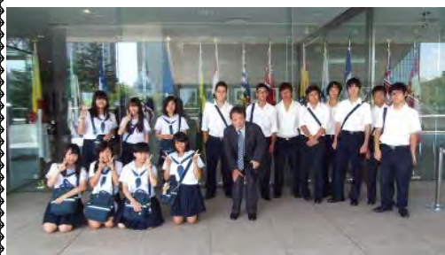
カナダ大使館前で、ちょっと緊張の面持ち。

② カナダ大使館・JICAちきゅうひろば訪問(青山、市ヶ谷) このグループは、午前中カナダ大使館の見学ツアーに参加し、午後から J I C A ちきゅうひろばで国際協力の取り組みについて学びました。