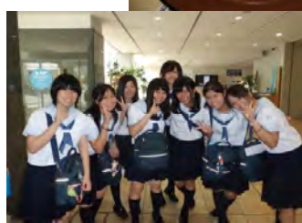
ユニセフのこと、みんなに教えてください。