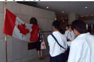
ガイドの方に説明を受けながら、館内を巡りました。

② カナダ大使館・JICAちきゅうひろば訪問(青山、市ヶ谷) このグループは、午前中カナダ大使館の見学ツアーに参加し、午後から J I C A ちきゅうひろばで国際協力の取り組みについて学びました。