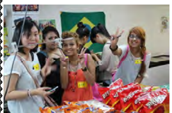
鶴見には、食料品店や雑貨店など、南米の方々が利用するお店がいくつもあります。生徒は近所のスーパーでは売っていないような食材に驚いたり、雑貨店ではアクセサリを買ったりしました。