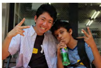
A B C ジャパンで学んでいる生徒は南米に限らず、世界各国から来ています。