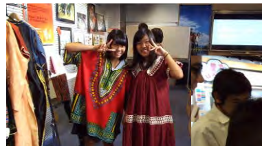
民族衣装を着てみました!