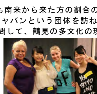
ブラジリアンダンスの先生方と、記念撮影。