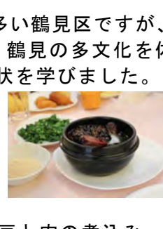
豆と肉の煮込み(フェイジョア)美味!