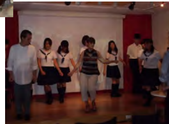
カフェリブロスでは南米のダンスを体験!