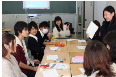
東日本大震災支援の団体のワークショップ。