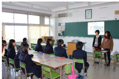
プロジェクターを駆使して活動をわかりやすく説明してくれました。