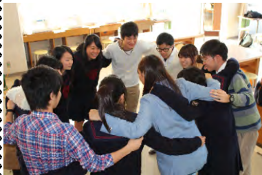
高校、大学、それぞれの場でがんばるぞー！