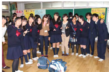
隼人生、明学生はすっかり仲良しに。

校外でのスピーチコンテスト参加、続々入賞！ 来年の受賞者はあなたです！ 一歩踏み出してやってみよう！