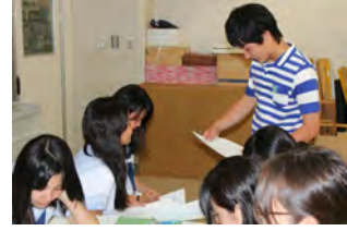
大学生の方と仲良くなれたかな？