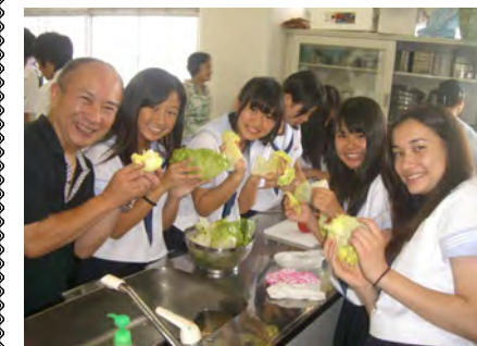
さんも、レタスを持って、はいチーズ！

Gold medal! I want to be a professional cyclist and win many races. I want to be a parson who is positive. I hope that my family and friends keep good health. I wish my grand parentes live a long life. I want to make foreign friends. I'd like to have a trust friends. I want to go to HarryPotters world.