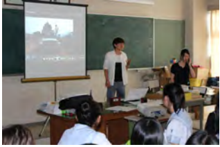
大学生の熱意が伝わるプレゼンでした！

KIV0来校！（7月8日）国際語科卒業生の先輩が設立した国際協力学生団体が来校し、ワークショップ形式で活動を紹介してくれました。自分たちとそれほど年齢の離れていない大学生のNGO活動に、国際2年生はみんな興味津々でした。