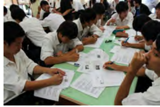
有名な「ハゲワシと少女」の写真を見ながら、「報道と人道のどちらを優先するか」ということを考えてみるフォトランゲージを行いました。